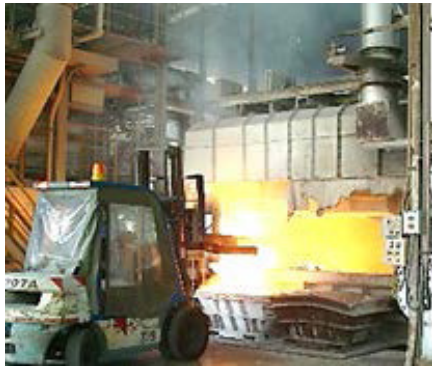
应用前： 手动废铝沉熔