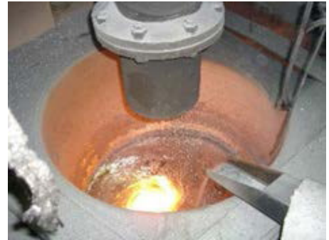
应用后： Pyrotek 的 LOTUSS 系统连续沉熔废料